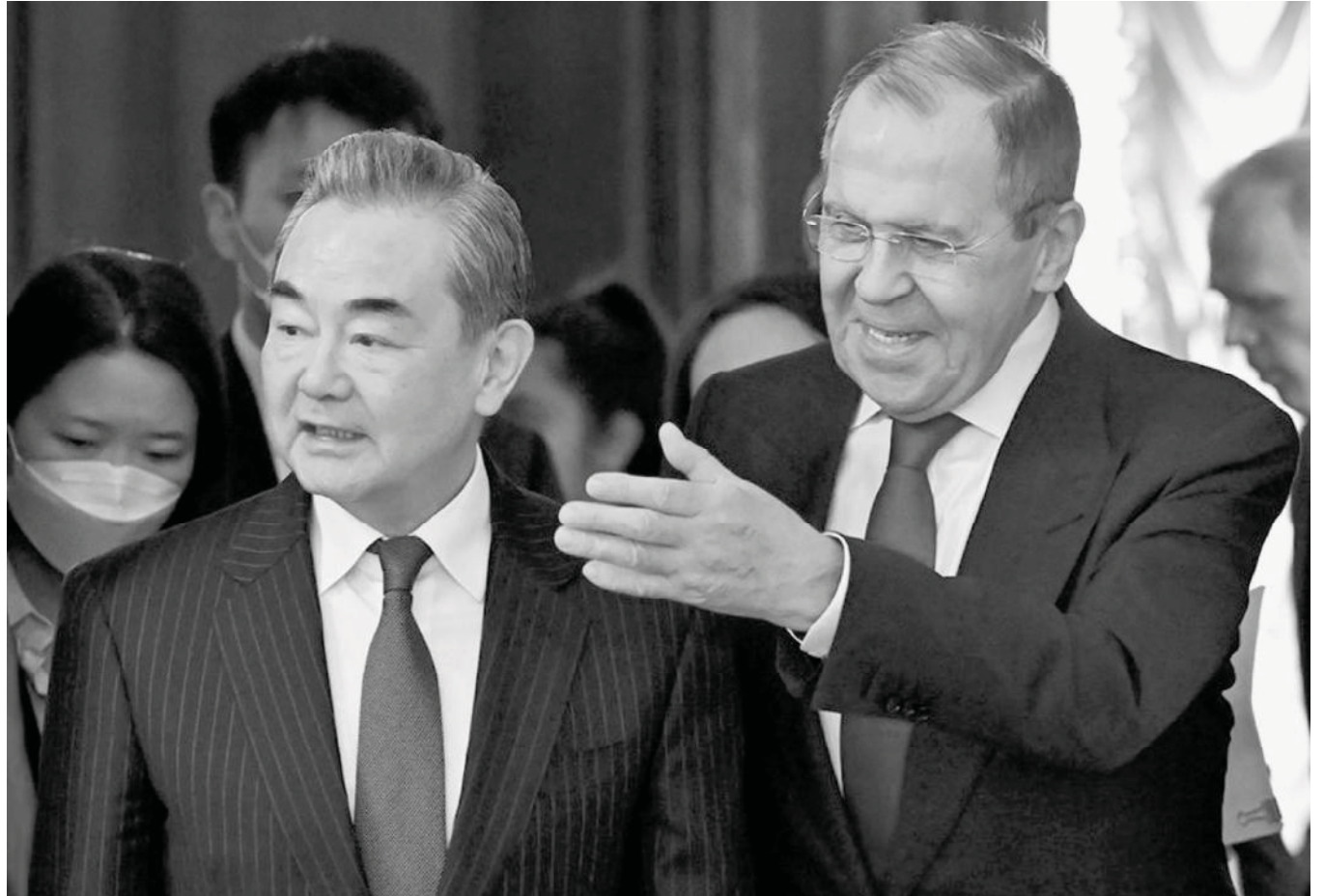
Министр иностранных дел России Сергей Лавров и глава канцелярии комиссии по иностранным делам ЦК китайской компартии Ван И на встрече в Москве